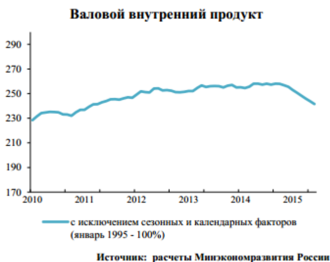
Рис.2 Валовой внутренний продукт

Описываются риски, связанные с политической и экономической ситуацией в стране (странах) и регионе, в которых эмитент зарегистрирован в качестве налогоплательщика и (или) осуществляет основную деятельность, при условии, что основная деятельность эмитента к такой стране (региону) приносит 10 и более процентов доходов за последний заверченный период до даты утверждения проспекта ценных бумаг.