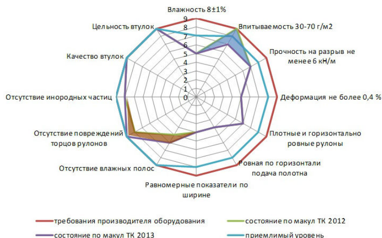
Рис. 3. Изменение качественных характеристик макулатурных тарных картонов в 2012 и 2013 гг.

Как и в 2012 г., в 2013 г. только по трем из 12 параметров отечественные макулатурные тарные картоны соответствуют требованиям эффективной переработки: