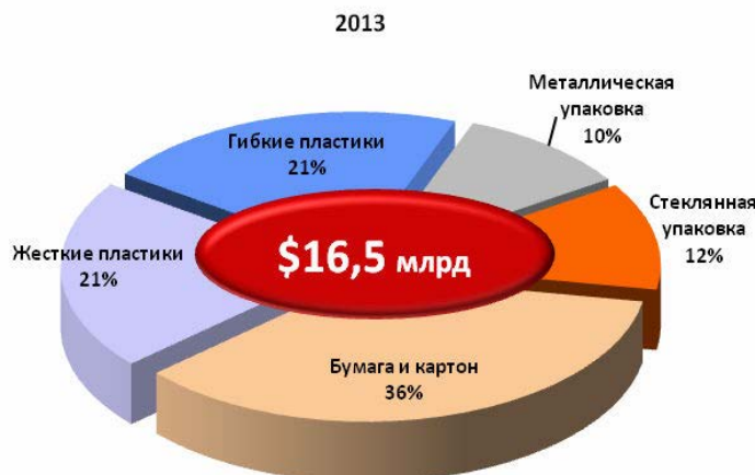
Рис. 1. Емкость российского рынка упаковки по основным сегментам

В 2013 г. емкость российской упаковочной отрасли, по нашим оценкам, составила около 16,5 млрд. долларов США. При этом трудно оценить влияние девальвации в конце 2013 г., так что это довольно скромная оценка.