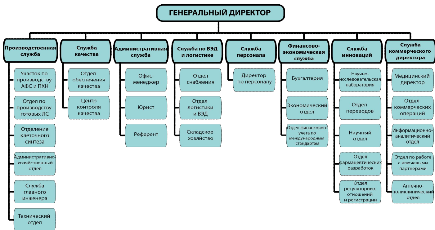
Организационная структура ОАО «Фармсинтез»