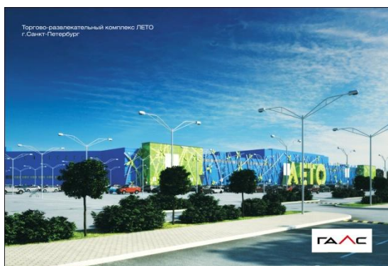
Торгово-развлекательный комплекс в г. Санкт-Петербурге по адресу: Пулковское шоссе д. 25, корп.1