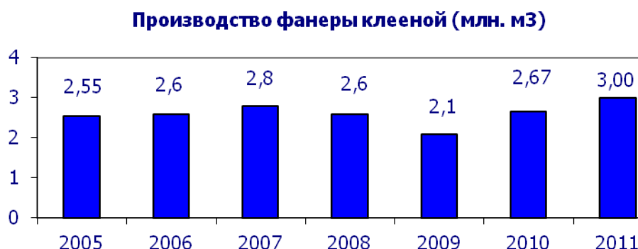
Рис. 3 Производство фанеры клееной

В 2011 году по всем основным видам продукции лесопромышленного комплекса по сравнению с 2010 годом отмечен рост производства, за исключением бумаги, объем выпуска которой остался на уровне 2010 года, что связано с недостатком имеющихся мощностей по выпуску конкурентоспособных видов бумаги.