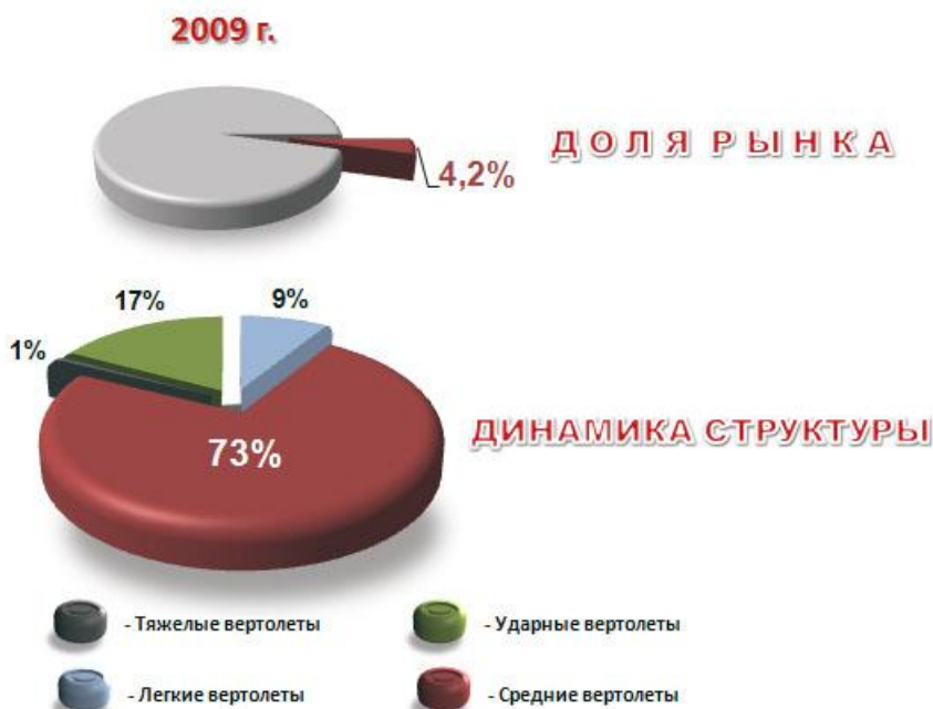
Рис.6.2. Доля рынка и динамика структуры российский вертолётов