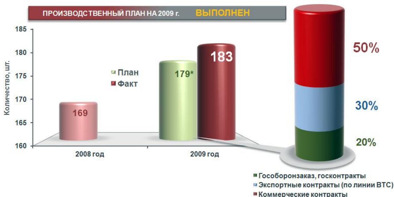
Рис.6.1. Выполнение производственного плана за 2009 г.