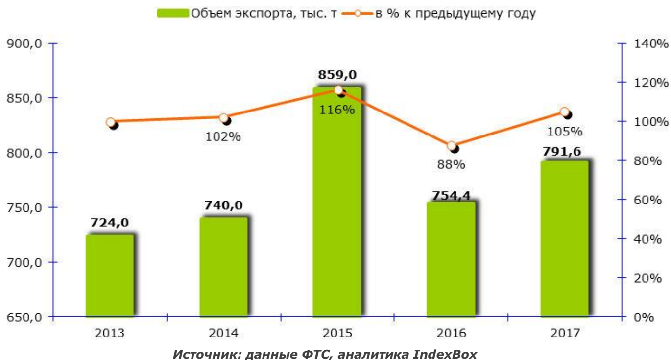
Рисунок 5. Объем экспорта картонной упаковки в 2013-2017 гг., тыс. т