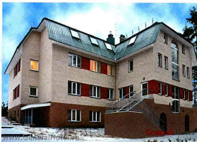
База отдыха «Орехово»