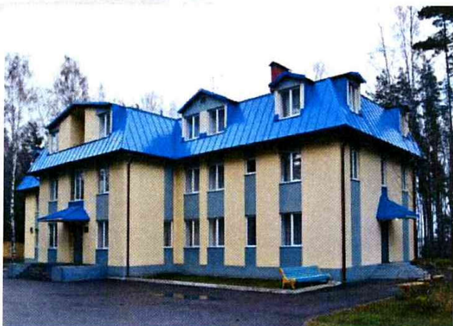
База отдыха «Манола»

2.5 Предоставление частичной или полной компенсации по оплате путёвок для работников Общества в санатории, пансионаты РФ и на базы отдыха Общества, а также частичная компенсация работникам Общества стоимости платных медицинских услуг, оказываемых Филиалом АО «Адмиралтейские верфи» Медицинский центр. В отчетном году сумма компенсаций составила более 30 млн. руб.