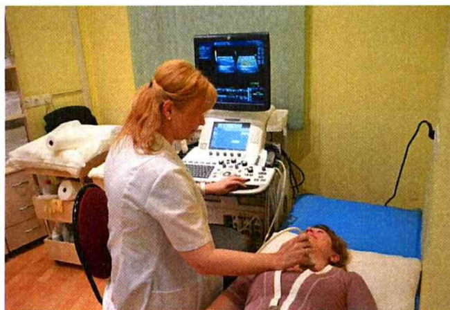
Медицинский центр «Адмиралтейские верфи»

2.6 Предоставление медицинских услуг в рамках договора добровольного медицинского страхования (ДМС) работникам Общества, а также ушедшим на заслуженный отдых работникам, которым присвоено почетное звание «Заслуженный адмиралтеец». В отчетном году данная сумма составила более 5 млн. руб.