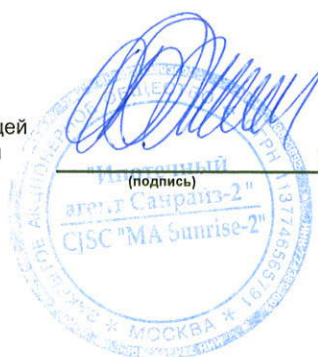
Белая Оксана Юрьевна (расшифровка подписи)