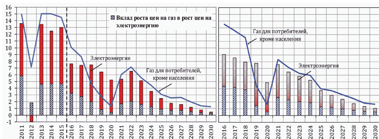
Динамика цен на газ и электроэнергию до 2030 года по вариантам (прирост цен в % к предыдущему году)

Консервативный сценарий (вариант 1) характеризуется умеренными долгосрочными темпами роста экономики на основе активной модернизации топливно-энергетического и сырьевого секторов российской экономики при сохранении относительного отставания в гражданских высоко- и среднетехнологичных секторах. Модернизация экономики ориентируется в большей степени на импортные технологии и знания.