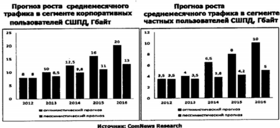
Рисунок 7. Прогноз увеличения трафика пользователей СШПД

По мнению органов управления общества, тенденции развития ОАО «КБ «Искра» в части оказания услуг связи соответствуют общеотраслевым тенденциям, что подтверждается следующими данными: