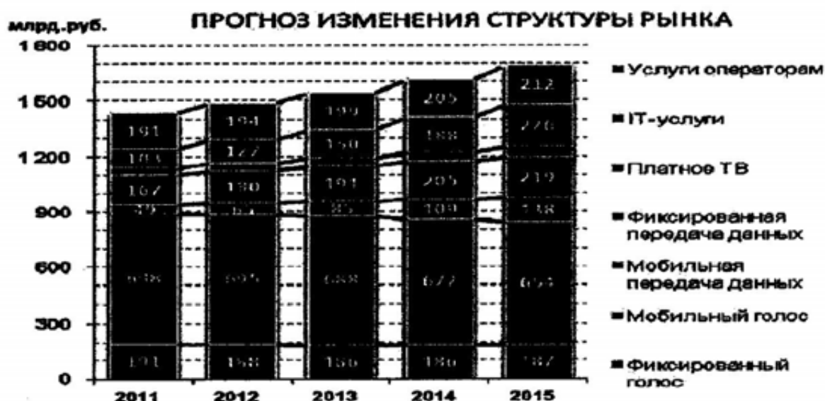
Рисунок 2. Прогноз изменения структуры телеком рынка (по данным ОАО «Ростелеком»).

Министерство связи рассчитывает, что тарифы на внутризональные соединения и местную связь будут ежегодно снижаться в среднем на 10%. За последние два года тарифы на сотовую связь снизились также на 10%.