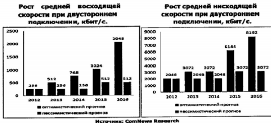
Рисунок 6. Прогноз увеличения скорости при двустороннем подключении

восходящая скорость вырастет на 700%. В случае развития событий по пессимистическому сценарию средние скорости в прямом и обратном каналах вырастут на 50 - 100%.